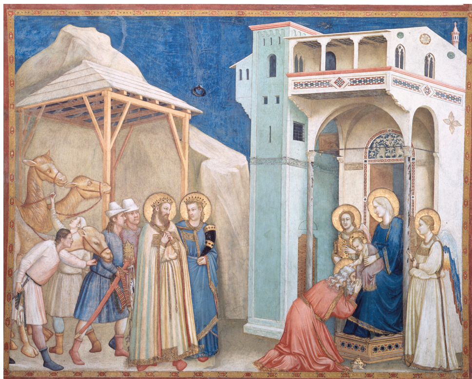
Giotto - L'adorazione dei Magi - Assisi, Basilica Inferiore di San Francesco