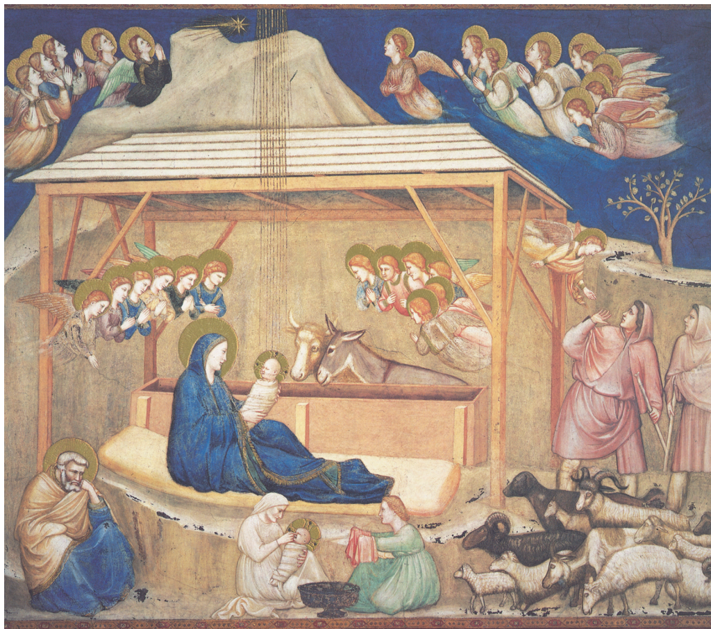
Giotto - Natività di Gesù - Assisi, Basilica Inferiore di San Francesco